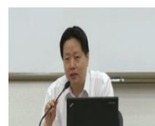
突发事件风险管理 课程学时：3.29学时

特殊情况下，部分院校根据自身实际情况，可能会开办专题培训，方便特定参训人员特别是新教师群体进行系统性线上学习。该类学员可在学校的统一安排下，可在“培训课单”频道下，一键选报所有应修的专题培训课程。具体情况，请以院校管理员通知为准。