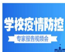
学校疫情防控专家报告视频会 课程学时：2.14学时