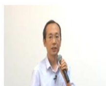
突发公共事件应急管理的策... 课程学时：2.82学时