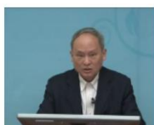
教师身心健康与压力管理 课程学时：2.58学时